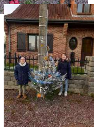
Les sapins installés dans le village magnifiquement décorés par les moncheillois !!