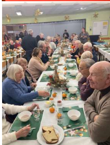
Petit déjeuner des Aînés et distribution des colis de Noël